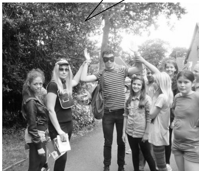
Politsei arreteerib kahtlast isikut