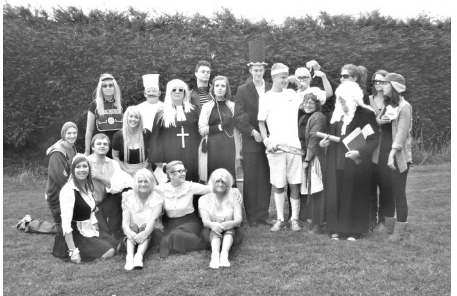
Kasvatajad aaretemängu kostüümides

Neljapäeva pärastlõunal toimus Catthorpe'i mõisas keeruline aaretemäng ja igale kasvatajale oli määratud näitleja roll. Lapsed pidid lahendama, kes oli varas ja ka kindlaks tegema mida varastati. Mäng kestis mitu tundi ja nalja ning naeru oli palju. Kas tunnete isikuid nendel piltidel .....?!