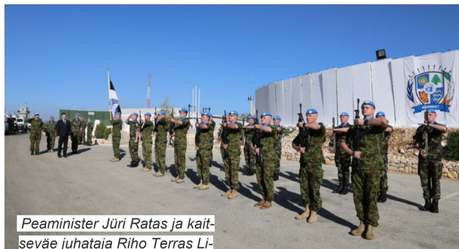
Peaminister Jüri Ratas ja kaitseväe juhataja Riho Terras Li-

Veteranide päev 23 aprillil tähistati Tallinnas kontserdiga Vabaduse väljakul. Veteranirockil esinesid Kaitseliidu Tallinna maleva bänd Mustad Kolonelid, Liis Lemsalu, Ott Lepland, Ivo Linna ja Karl-Erik Taukar Band.