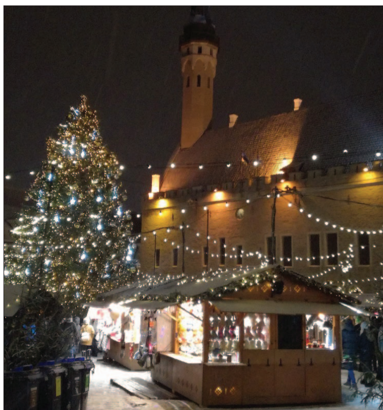
Raekoja platsi Jõuluturg

Vana aasta õhtul on sajandite jooksul olnud olulisem inimesaastuse ennustamise aeg. Tuntum neist on tina valamine, mis on tänini elav tava.